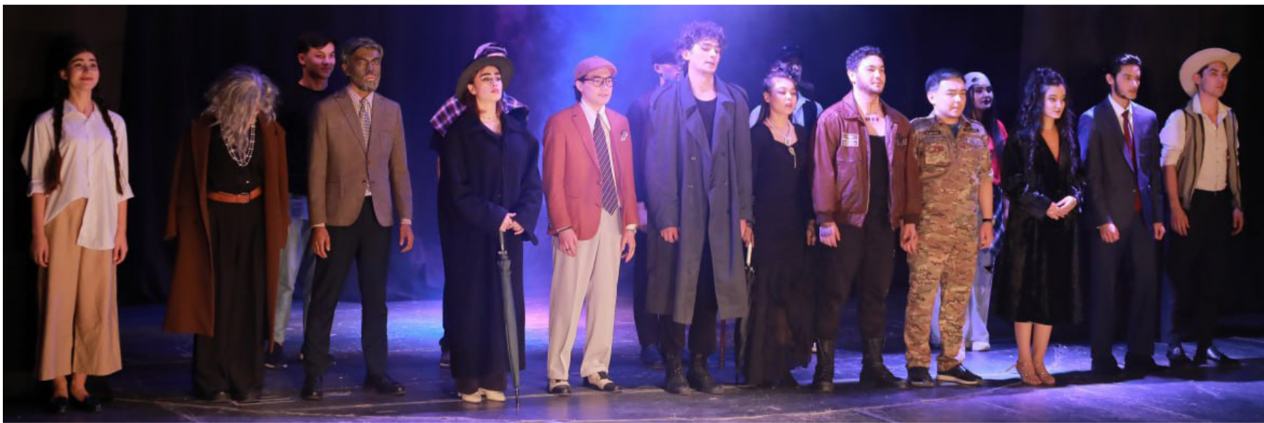
◀ Boshlanishi 4- betda

boshqaruv tizimini xalqchil qilish imkonini berdi. Shu bilan birga, elektron hukumat tizimining keng joriy etilishi, raqamli texnologiyalardan foydalanish, davlat xizmatlarini onlayn ko'rsatish amaliyoti fuqarolar uchun qulaylik yaratib, boshqaruvda samaradorlikni oshirdi. Islohotlarning muhim jihatlaridan yana biri bu korrupsiyaga qarshi kurashish, halollik va adolat tamoyillarini ustuvor qilishdir. Davlat xizmatchilari faoliyatida ochiqlikni ta'minlash, ularning moddiy va ma'naviy manfaatlarini himoya qilish orqali boshqaruv jarayonlarida sog'lom muhit yaratilmoqda. Shu bilan birga, kadrlar siyosatida yangilanishlar amalga oshirilib, bilimli, zamonaviy tafakkurga ega va tashabbuskor yoshlar rahbarlik lavozimlariga jalb qilinmoqda.