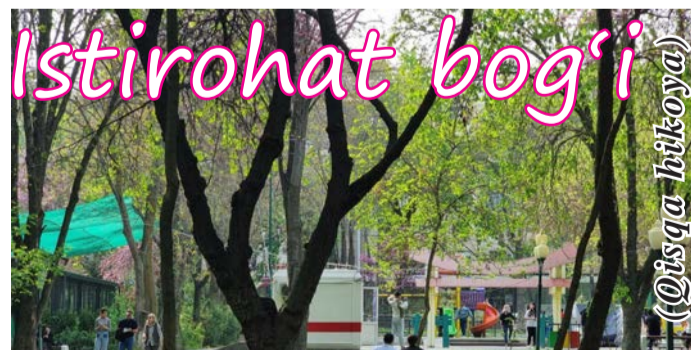
Tepadan tanish ovoz: – Voy qizim, ehtiyot bo'lsang bo'lmaydimi? Qo'lida romol, qaddi tik, ko'zlarida faqat mehr bor edi.

"Eh!" Cho'zilgan bo'yi va og'ir jussasi atrofda g'ildirak e'tiborini tortgan, kimdir achingan bo'lsa, yana kimdir tekin tomosha, deb jilmayganicha tikilgan. Qizning hayoli hamon onasining romolida.