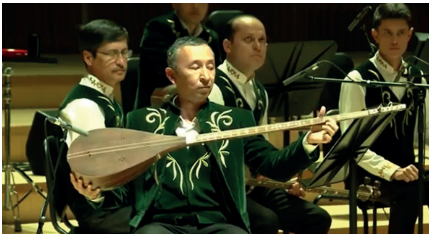
Солисты Узбекского камерного оркестра народных инструментов «Согдиана»

ступает эффективным интеграционным каналом в мировое культурное пространство, обеспечивая диалог традиций и современности, национального и универсального художественного опыта.