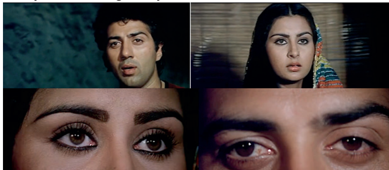
“Sevgi afsonasi” filmi kadrlaridan lavhalar

Zamonaviy kino estetikasi sevgi munosabatlarini realistlik, ko'p qavatli psixologik tajriba sifatida talqin etishni kuchaytirdi. Shu bilan birga, o'zbek va hind kinolarida milliy mentalitet, madaniy kodlar, urf-odatlar va ijtimoiy axloq me'yorlari hali ham sevgi obrazining asosiy semantik negizini belgilab, unga mahalliy rang-baranglik, ramziy qatlamlar va identitetga xos badiiy shakllar bag'ishlaydi.