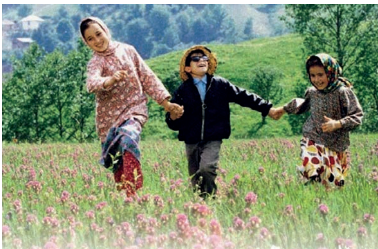
Majid Majidi "Jannat rangi" (The Color of Paradise) filmidan kadr

Muallifning nigohi tabiiy muhitni, ayniqsa tabiat manzaralarini lirik va vizual ta’sirchanlik bilan tasvirlaydi. Yorqin ranglar hayot, umid ramzlari. Tabiat manzaralari inson ma’naviyati bilan bog’liq falsafiy qarashlarga urg’u beradi.