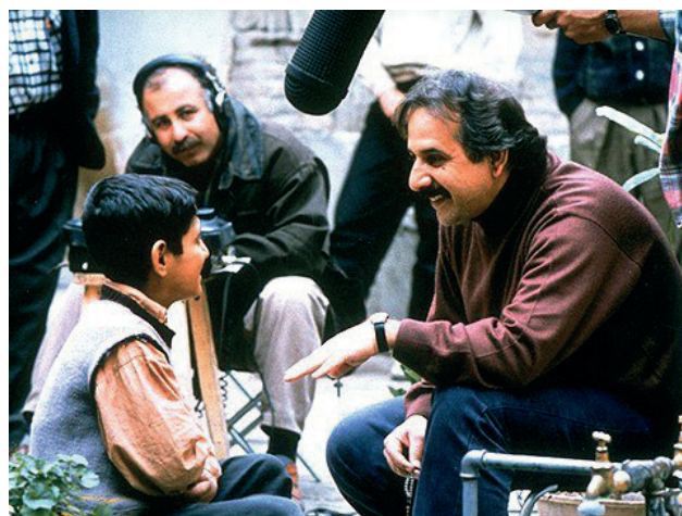
Majid Majidi "Osmon bolalari" filmidagi bosh qahramon bilan suratga olish maydonida

Eron kinosining eng nufuzli ijodkorlaridan biri Abbas Kiarostami bo'lib, uning ijodida bolalar mavzusi alohida o'rin tutadi. "Do'stimning uyi qayerda?" (Where is the friend's house? 1987-y.) filmida ham bolalarning qarama-qarshi jamiyat va insoniy munosabatlari so'zsiz, minimalizm, metaforalar orqali namoyon qilinadi. A.Kiarostaming uslubi keyinchalik Eron kinosining yana bir zabardast vakili Majid Majidining ijodiga katta ta'sir ko'rsatdi. Uning filmlaridagi realizm va insonning ichki olamiga