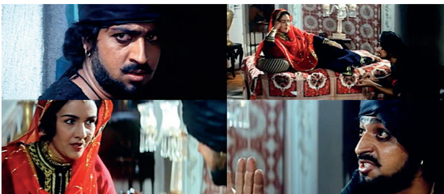
“Sevgi afsonasi” filmi kadrlaridan lavhalar

“Sevgi afsonasi” (1984) filmi dramaturgik jihatdan o'zbek kinosining 1980-yillar lirik-romantik