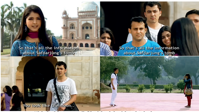
“Muhabbatnoma” filmi kadrlaridan lavhalar

muhabbat sahnalarining ruhiy ohangini aniqroq shakllantirish imkonini yaratdi. Shu tariqa, zamonaviy hind kinosida sevgi konseptining vizual poetikasi texnologik yangilanish, kamera harakati va psixologik kompozitsiya oʻrtasidagi murakkab badiiy uygʻunlik sifatida namoyon boʻladi.