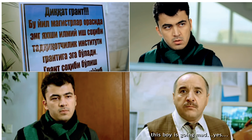
"Muhabbatnoma" filmi kadrlaridan lavhalar

O'zbek va hind kinosida sevgi konseptining turli davrlardagi badiiy va tasviriy ifodasi namunasi sifatida "Muhabbatnoma" filmni ham keltirish mumkin. Ushbu film o'zbek kinosida romantik konsepsiyaning yangi bosqichini belgilagan asarlardan biri bo'lib, unda sevgi voqealari shaxsiy psixologiya, ichki kechinmalar va zamonaviy ijtimoiy omillar bilan uyg'un tarzda talqin etiladi.