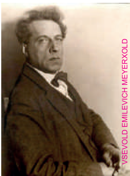
VSEVOLD EMILEVICH MEYERXOLD

Meyerxold (uning bolalikdagi ism-sharifi Karl Kasimir Theodor Meyerxold, keyinchalik Meyerxold-Rayx, deb chaqirishgan) Penzada (1874–1940)