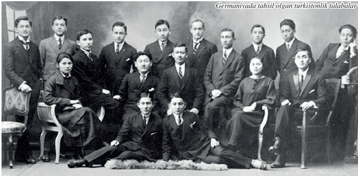
Germaniyada tahsil olgan turkistonlik talabalar