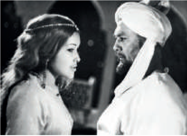
“Abu Rayhon Beruniy” O‘zbekfil‘m 1974- yil

tasviriy san‘atning sirli olami bilan tanishtirishga xarakat qilishi edi. Talabalar muzeylarga borishi, bir hafta davomida kamida bitta kartinani (qaysi janrdaligidan qat‘iy nazar) qunt bilan kuzatishi, mavzu, janr va qaysi maktabga taalluqli ekanligini mukammalroq o‘rganishi kerak bo‘ladi. Ma‘lumki, tasviriy san‘at asarlarida rassom biron-bir hayotiy yoki tarixiy voqeaning eng yuqori nuqtasini, o‘z hayotiy kuzatuvlarining bir lahزالik, o‘zining ijodiy fantaziyasini bezovta qilgan onlarini bir umrga muhrlab qo‘yadi. Ustozning talabi va maqsadi bitta kartina atrofida talabalarning o‘z fantaziyasi va tasavvurlarini ishga solib, rassom tasvirlagan voqeaga olib keladigan uzluksiz xatti-harakatni, voqealar zanjirini o‘z tasavvurlari ekranida yaratishi va shundan keyin o‘z kursdoshlariga voqealar silsilasini tushuntirish edi.