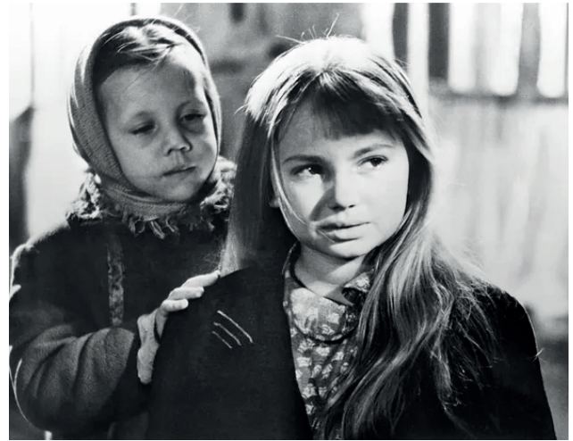
“Sen yetim emassan” O‘zbekfil‘m 1962- yil

“Ko‘pincha insonlar o‘z iztirob, g‘am-tashvishlarini odamlar ko‘zidan yashirish uchun xotirjam ko‘rinishga