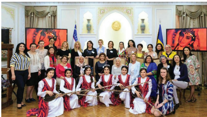
“Нозанин” ансамблининг Украина давлатига ижодий сафари

Бу каби ижодий изланишлар эса дутор ижрочилик санъатидаги дастурларни кенгайтиришига сабаб бўлди. Уларни келажак авлодга қолдириш мақсадида