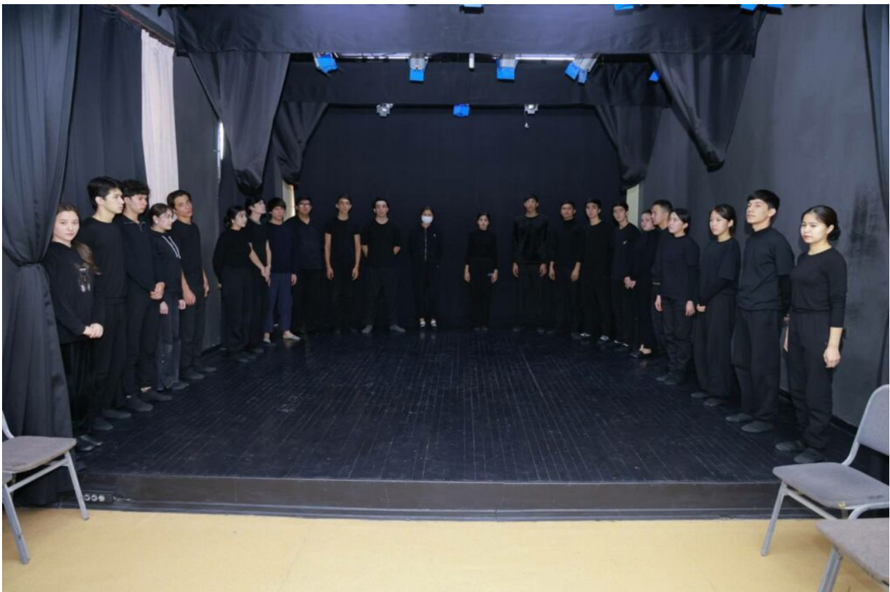
Xususan, Xalq ijodiyoti fakulteti "Ashula va raqs" ta'lim