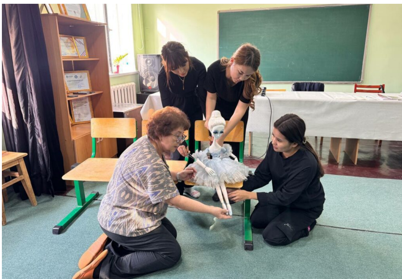
Jarayon davomida filial va institut o'rtasida o'zaro tajriba